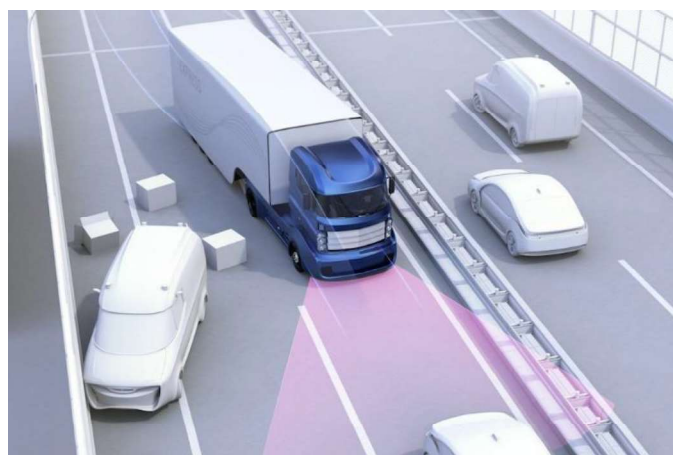
Figure.1. Overview of designing of the project

The experimental phase involved the development of a prototype automatic accident-avoiding system. The prototype was designed to incorporate various sensors, including ultrasonic sensors, LiDAR, and cameras, to detect obstacles in the machine's environment. These sensors were selected for their ability to provide accurate and timely data regarding the proximity of potential hazards.