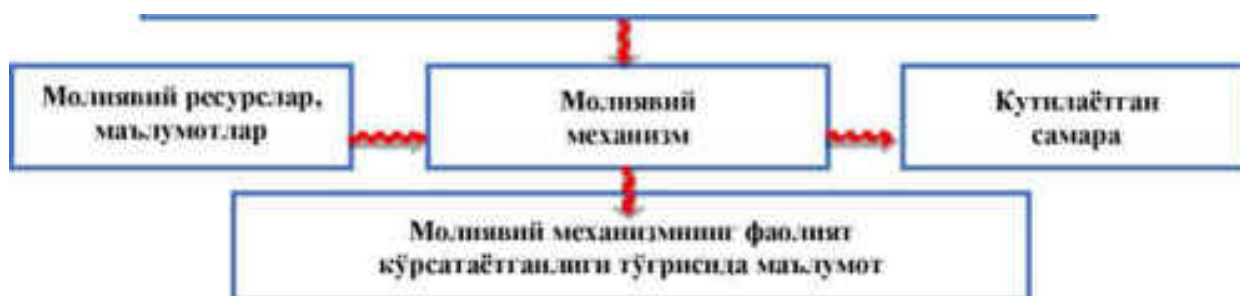
1-расм. Молиявий механизм фаолият кўрсатишининг блок201

Юқорида баён қилинганлар асосида, фикримизча, молиявий механизмга қуйидагича таъриф бериш мумкин: маълум мақсад асосида фаолият кўрсатадиган, молиявий ресурсларни шакллантириш ва тақсимлаш усулари ва дастакларидан фойдаланадиган молиявий муносабатлар тизимидан иборат бўлган хўжалик механизмнинг бир қисмига молиявий механизм дейилади.